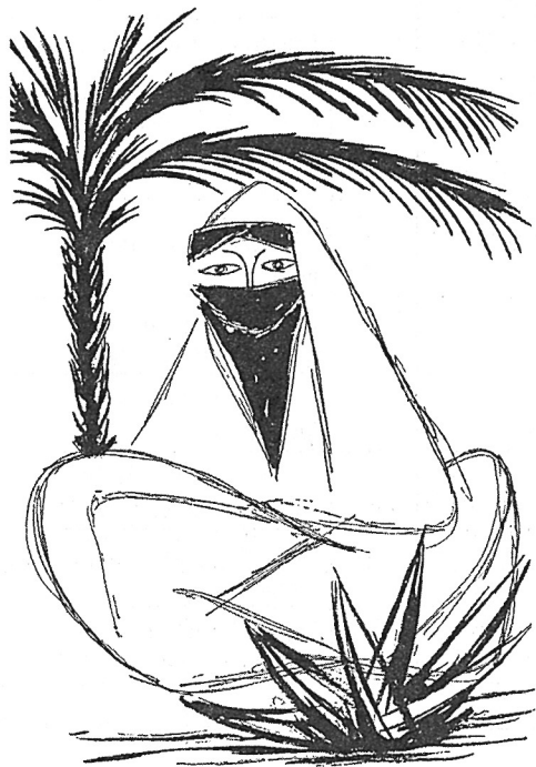
Illustration de Charles Daudelin au chapitre intitulé « Un monde en mouvement : le monde arabe ». Dans : idem , p. 310. © Succession Charles Daudelin / SODRAC (2006).